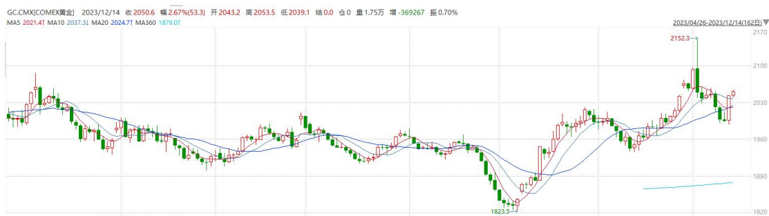
图表6COMEX黄金日线走势图

往后看，短期内利率预期下调或使美债收益率及美元指数持续承压下行，贵金属价格或得到相应提振。操作上建议，日内轻仓做多，请投资者注意风险控制。