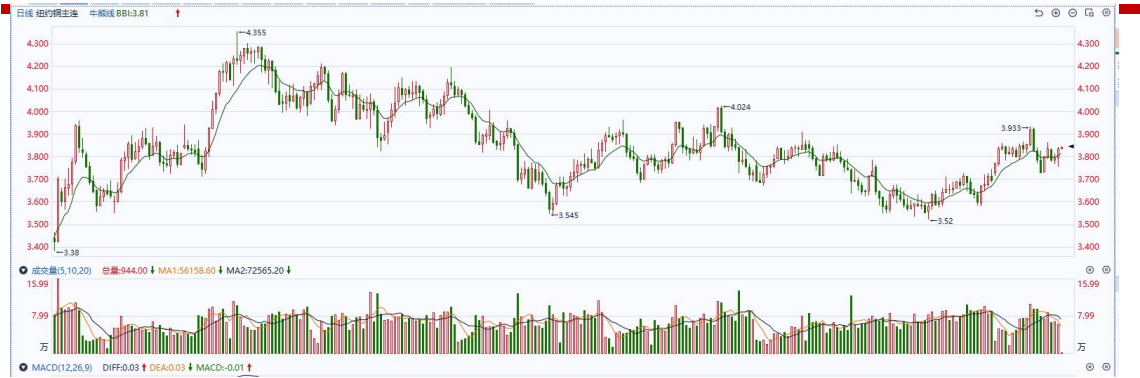
图表5COMEX铜日线走势图