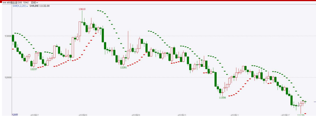
图表4富时中国A50指数期货日线走势图及支撑位