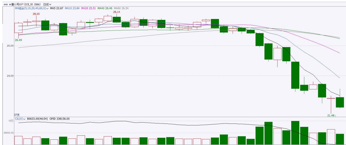
图表8 ICE原糖期货主力合约日走势图及支撑位、阻力位

洲际期货交易所（ICE）原糖期货周三收低，受累于持续的基金抛售。交投最活跃的ICE 3月原糖期货合约收盘收跌0.62美分或2.70%，结算价每磅21.97分。操作上，建议3月 ICE 原糖短期观望为主。