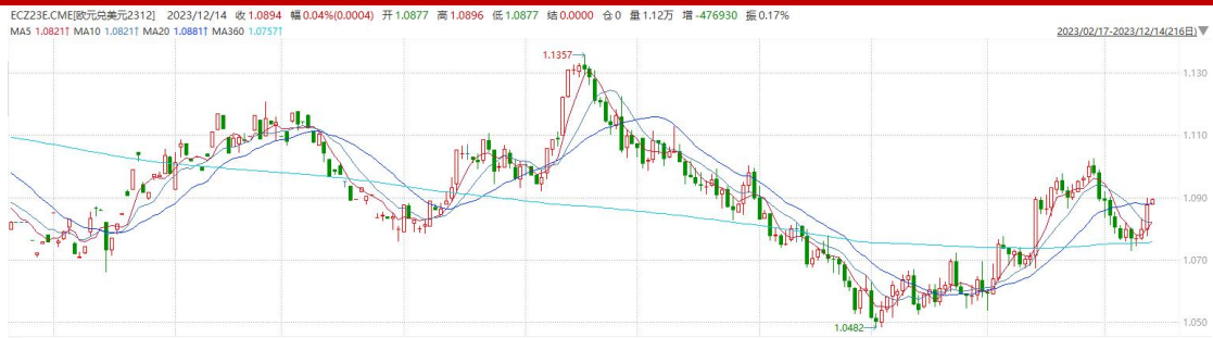
图表 2 欧元兑美元主力合约走势图