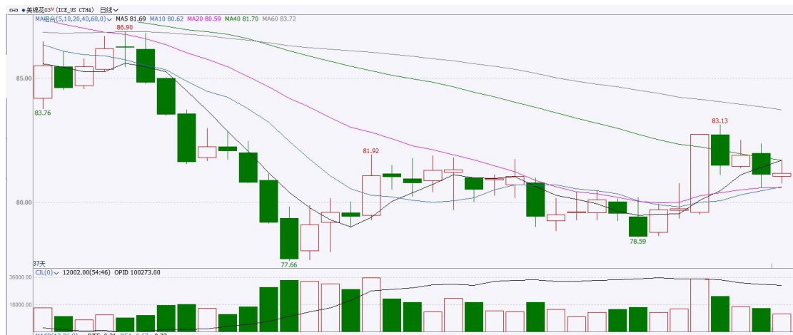
图表9 ICE棉花期货主力合约日走势图及支撑位、阻力位

洲际交易所（ICE）棉花期货周三持稳，美国农业部周度出口销售数据发布之前，交易商持观望态度。交投最活跃的ICE 3月期棉收涨0.13美分或0.20%，结算价报81.18美分/磅。操作上，建议3月 ICE 期棉短期逢高抛空思路对待。