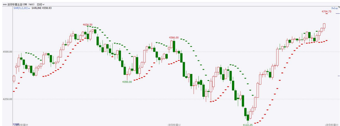
图表3S&P500指数期货日线走势图及支撑位

截至 12 月 13 日，标普 500 指数收涨 0.46% 至 4643.70 点；迷你标普 500 主力合约收涨 0.54% 至 4649.25 点。美股周二录得连续第四个交易日上涨。三大股指均创年内新高，标普 500 指数回升至 2022 年 1 月以来的最高水平。美国 11 月 CPI 创 6 月以来最低增速。市场关注美联储政策会议，希望据此判断未来的货币政策路径。策略上，指数短线突破高位，轻仓试多。详细支撑阻力位请见图表 4。