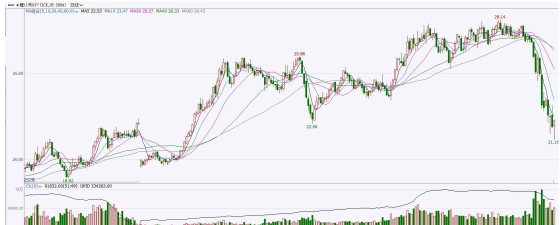
图表8 ICE原糖期货主力合约日走势图及支撑位、阻力位

洲际期货交易所（ICE）原糖期货周四收涨，从之前触及的八个半月低位温和反弹。交投最活跃的ICE 3月原糖期货合约收盘收涨0.21美分或1.0%，结算价每磅22.18分。操作上，建议3月 ICE 原糖短期观望为主。