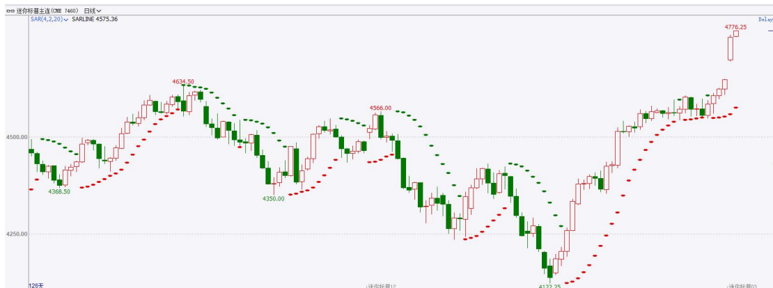
图表3S&P500指数期货日线走势图及支撑位

截至 12 月 14 日，标普 500 指数收涨 0.26% 至 4719.55 点；迷你标普 500 主力合约收涨 0.15% 至 4768.5 点。美股周四连续第六个交易日上涨，道指再创历史新高。美国国债收益率大幅下跌，10 年期国债收益率跌破 4%。美国 11 月零售销售意外攀升，增强了投资者对经济软着陆的信心。策略上，指数短线突破高位，轻仓试多。详细支撑阻力位请见图表 4。