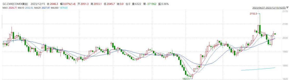
图表6COMEX黄金日线走势图

往后看，短期内美债收益率及美元指数在市场下调未来美国利率预期的影响下或持续承压下行，贵金属或持续上涨。操作上建议，日内轻仓做多，请投资者注意风险控制。