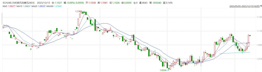
图表 2 欧元兑美元主力合约走势图