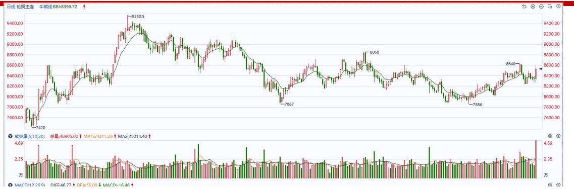
图表5COMEX铜日线走势图