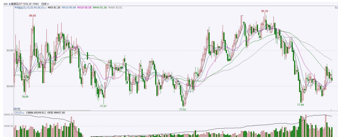
图表9 ICE棉花期货主力合约日走势图及支撑位、阻力位

洲际交易所（ICE）棉花期货周四下跌，因来自美元走软支撑被出口销售下滑的报告所抵消。交投最活跃的ICE 3月期棉收跌0.37美分或0.40%，结算价报80.81美分/磅。操作上，建议3月 ICE 期棉短期逢高抛空思路对待。