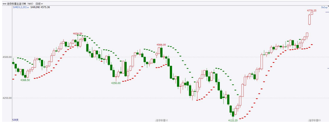
图表3 S&P500指数期货日线走势图及支撑位

截至12月20日，标普500指数收涨0.59%至4768.37点；迷你标普500主力合约收涨0.58%至4818.25点。美股周二收高。道指连续第九个交易日上涨，并再攀新高。标普指数逼近历史纪录。纳指近两年来重新站上15000点。市场预期美联储最早明年3月降息，但多位美联储官员试图口头打压市场对降息的过度乐观情绪。策略上，指数短线突破高位，轻仓试多。详细支撑阻力位请见图表4。