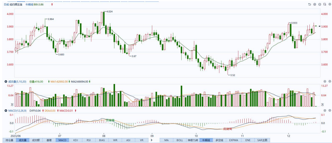
图表5COMEX铜日线走势图

质的有效提升和量的合理增长。操作上，建议 COMEX 铜 2403 合约轻仓逢低短多交易，注意交易节奏及风险控制。