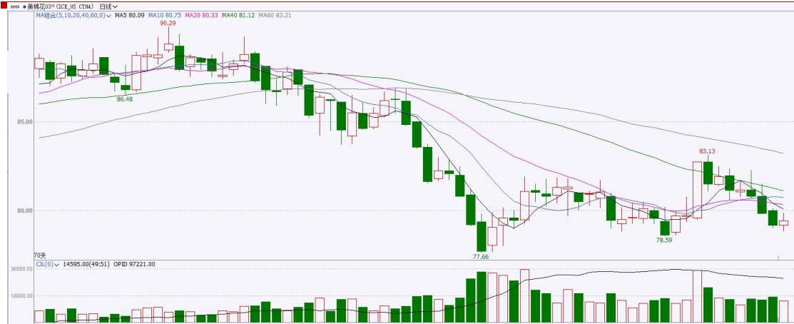
图表 9ICE 棉花期货主力合约日走势图及支撑位、阻力位