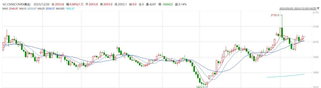
图表6COMEX黄金日线走势图

往后看，短期内美债收益率及美元指数受降息预期计价过度充足影响或多于高位震荡，后继上涨或仍需经济数据实证加以推动。操作上建议，日内轻仓做空，请投资者注意风险控制。