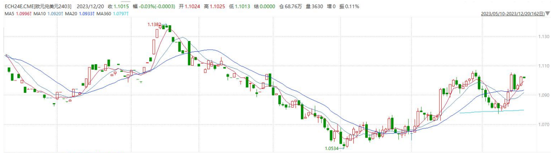
图表2 欧元兑美元主力合约走势图

2.9%，核心CPI终值同比上升4.2%，预期及初值均为升4.2%。欧元区通胀问题再次得到缓解，市场对后继欧洲央行降息呼声或有所抬高。往后看，美元指数短期内受非美国国家通胀担忧减弱且经济预期走强的影响或相对承压。