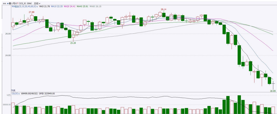
图表8 ICE原糖期货主力合约日走势图及支撑位、阻力位

洲际期货交易所 (ICE) 原糖期货周二收高，盘中触及八个半月低点后出现逢低承接买盘，受印度糖产量下滑担忧支撑。交投最活跃的ICE 3月原糖期货合约收盘收涨0.12美分或0.60%，结算价每磅21.43分。操作上，建议3月 ICE 原糖短期观望为主。