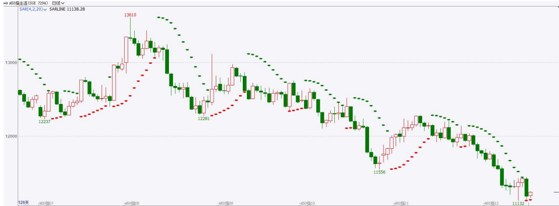
图表4富时中国A50指数期货日线走势图及支撑位

备韧性，海外流动性拐点仍需验证。在政策积极发力的背景下，随着短期风险因素收敛，市场交易或将转向政策预期，政策预期或将成为打破市场震荡行情的重要催化因素。策略上，短线谨慎，中长线逢低试多。详细支撑阻力位请见图表 4。