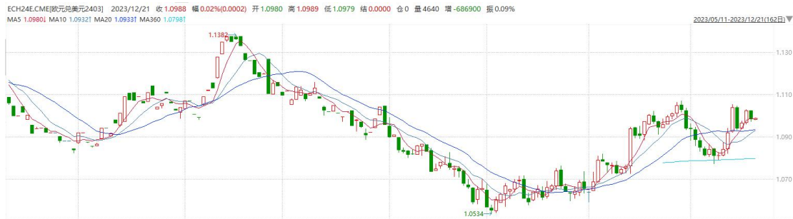
图表 2 欧元兑美元主力合约走势图