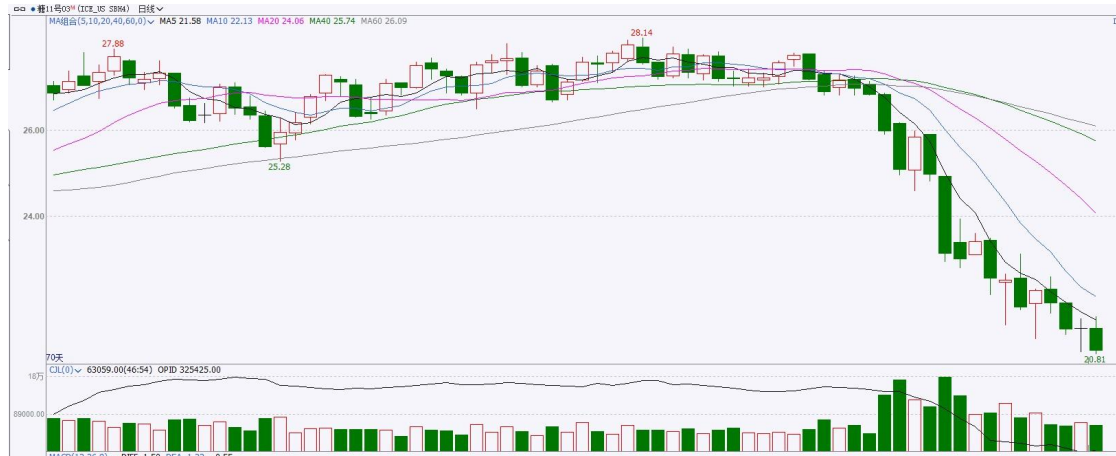
图表8 ICE原糖期货主力合约日走势图及支撑位、阻力位

洲际期货交易所 (ICE) 原糖期货周三创下新的八个半月低点，因基金轧平手中余下的多头头寸。交投最活跃的ICE 3月原糖期货合约收盘收跌0.51美分或2.40%，结算价每磅20.92分。操作上，建议3月 ICE 原糖短期观望为主。