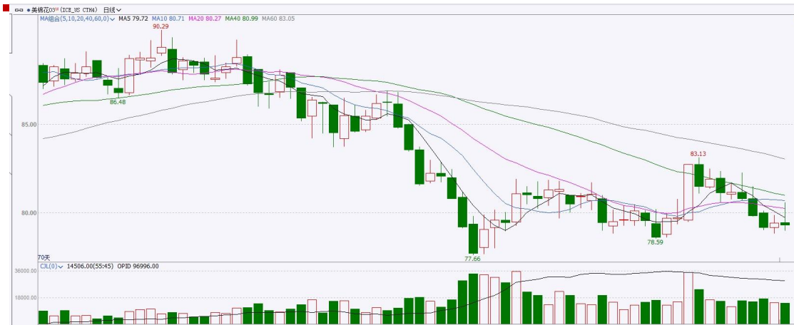
图表 9ICE 棉花期货主力合约日走势图及支撑位、阻力位