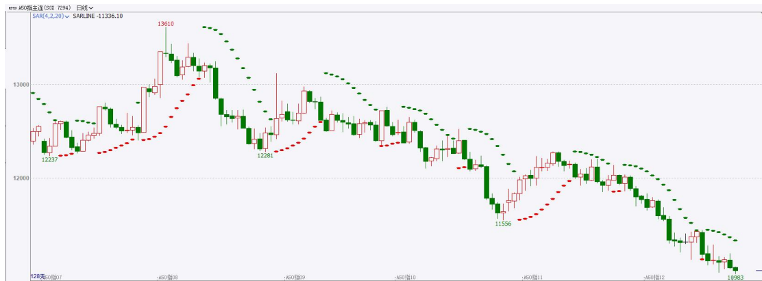
图表4富时中国A50指数期货日线走势图及支撑位

素收敛，市场交易或将转向政策预期，政策预期或将成为打破市场震荡行情的重要催化因素。策略上，短线谨慎，中长线逢低试多。详细支撑阻力位请见图表 4。