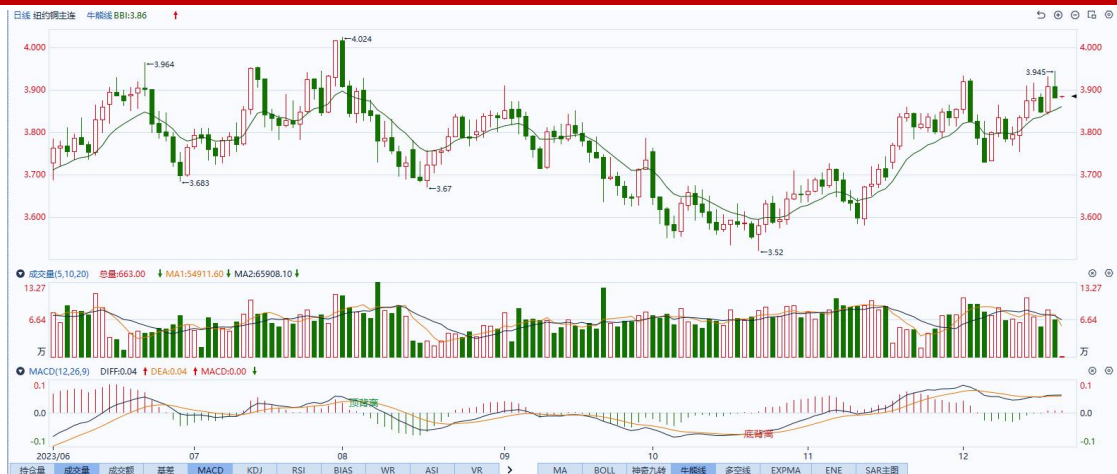
图表5COMEX铜日线走势图