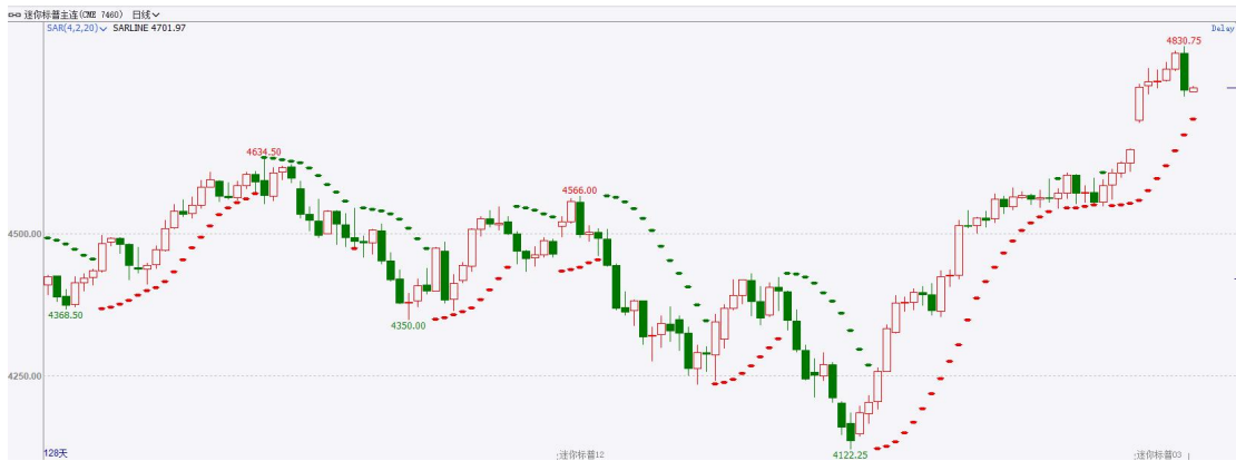
图表3S&P500指数期货日线走势图及支撑位

截至 12 月 21 日，标普 500 指数收跌 1.47% 至 4698.35 点；迷你标普 500 主力合约收跌 1.35% 至 4753.35 点。美股周三大幅收跌。随着投资者在近期美股连涨之后落袋为安，道指与纳指均止步九连涨。被视为经济晴雨表的联邦快递业绩不佳股价暴跌，令美股承压。多位美联储官员口头打压市场流行的“最早明年 3 月降息”的预期。策略上，指数短线突破高位，轻仓试多。详细支撑阻力位请见图 4。