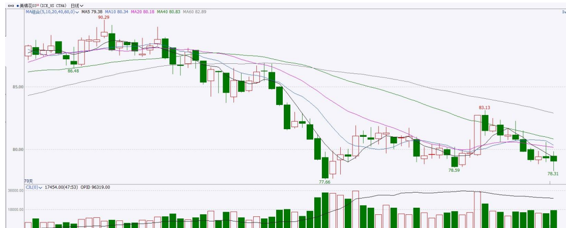
图表 9 ICE 棉花期货主力合约日走势图及支撑位、阻力位

洲际交易所(ICE)棉花期货周四下跌，因中国以外市场消费低迷，反映出服装相关行业的下游活动疲弱。交投最活跃的 ICE 3 月期棉收跌 0.08 美分或 0.10%，结算价报 79.13 美分/磅。操作上，建议 3 月 ICE 期棉短期逢高抛空思路对待。