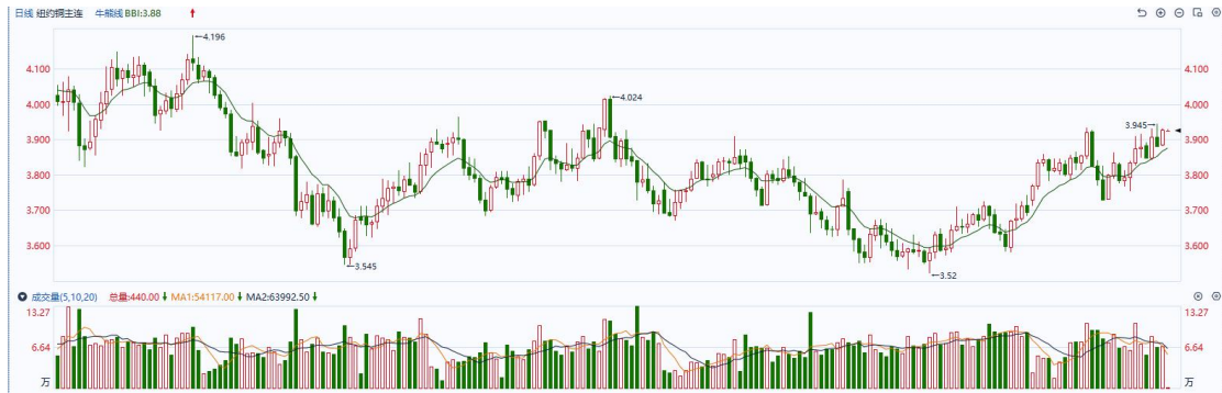
图表5COMEX铜日线走势图

行以刺激居民消费和企业投资。操作上，建议 COMEX 铜 2403 合约轻仓逢低短多交易，注意交易节奏及风险控制。