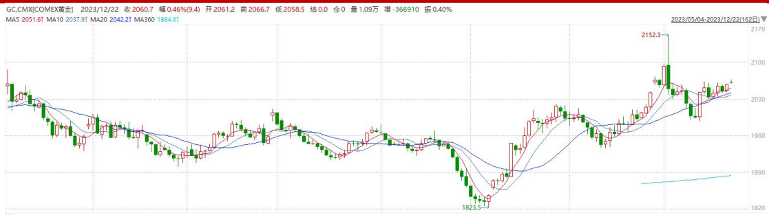
图表6COMEX黄金日线走势图