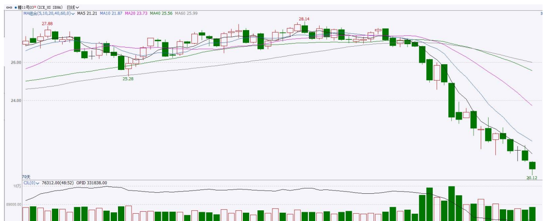
图表8 ICE原糖期货主力合约日走势图及支撑位、阻力位

洲际期货交易所 (ICE) 原糖期货周四触及九个月低点，因头号产国巴西的糖产量飙升，且对天气的担忧缓解。交投最活跃的ICE 3月原糖期货合约收盘收跌0.68美分或3.3%，结算价每磅20.24美分。操作上，建议3月 ICE 原糖短期观望为主。