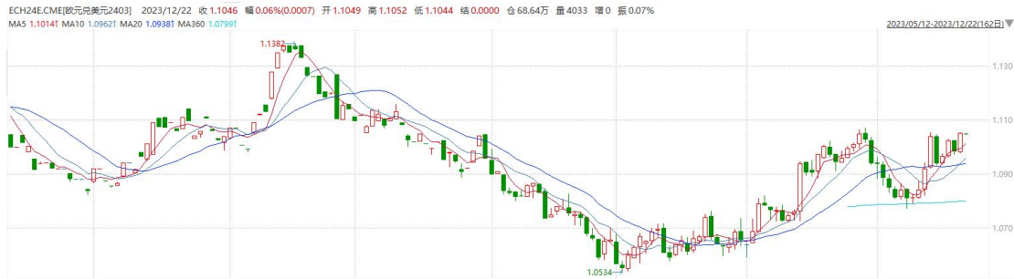
图表 2 欧元兑美元主力合约走势图

平接连下调的情况下，市场或再次前置明年美联储降息节点，短期内美元指数受利率预期下修的影响或将相对承压。