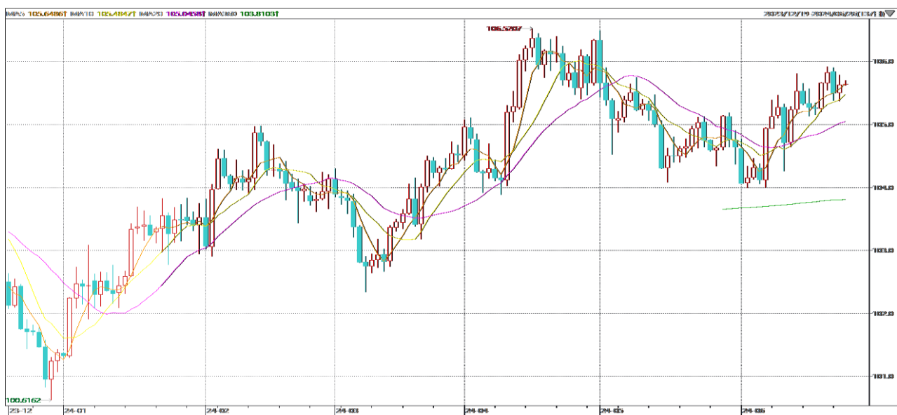
图表2：美元指数走势图

展望未来，由于鲍曼的鹰派言论推高了美国债收益率，欧债收益率集体收跌，欧美利差扩大对欧元构成了压力。