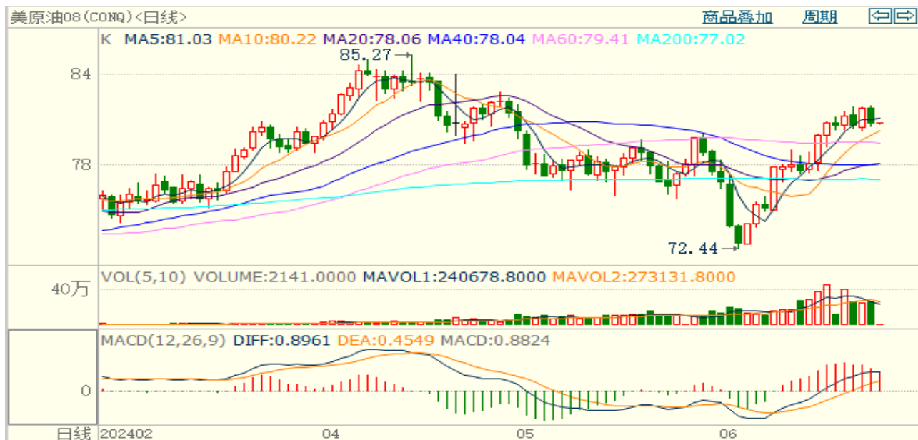
图7: 原油 (WTI) 走势图

国际原油市场出现回落，布伦特原油8月期货合约收盘价报85.01美元/桶，大幅1.1%；美国WTI原油8月期货合约收盘价报80.83元/桶，跌幅1%。美国6月消费者信心指数放缓，美联储官员发表鹰派言论，美元指数小幅上升。欧佩克联盟部长级会议同意将自愿减产措施延长至9月底，将集体性减产措施延长至2025年结束；乌克兰频繁袭击俄罗斯能源设施，以色列与黎巴嫩真主党冲突升级，地缘局势风险有所上升；API美国原油及汽油库存意外增加，美国夏季驾车季平淡开场，市场对于需求前景的担忧有所升温，短线原油期价呈现宽幅震荡。技术上，SC2408合约考验610区域支撑，上方测试625区域压力，短线呈现震荡走势。操作上，建议短线交易为主。