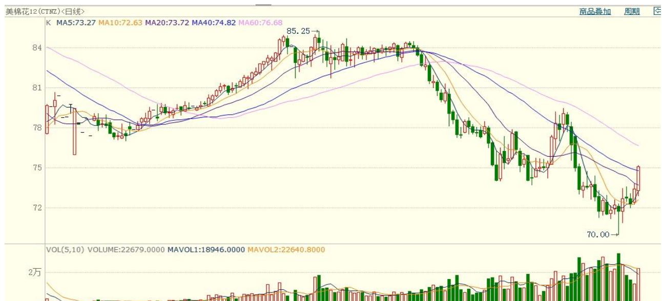
图8：ICE棉花期货主力合约日走势图

洲际交易所(ICE)棉花期货周二反弹，受助于空头回补。交投最活跃的ICE 12月期棉收涨1.18美分或1.60%，结算价报73.39美分/磅。美国农业部（USDA）最新发布的6月份全球棉花供需预测报告，全球棉花2023/24年度及2024/25年度棉花产量预期环比小幅调增，期末库存环比也小幅增加；中国市场2023/24年度和2024/25年度产消环比持平，期末库存均小幅下降。数据显示全球棉花格局承压，中国弱稳，而市场实际需求却随着夏季高温高湿的到来，全球纺织品需求逐步走弱，纺织淡季氛围的逐步发酵，棉花期货价格内外同步下跌。美棉主力价格关注上方压力80.0美分/磅，下方支撑66.0美分/磅。建议12月 ICE 期棉短期观望。