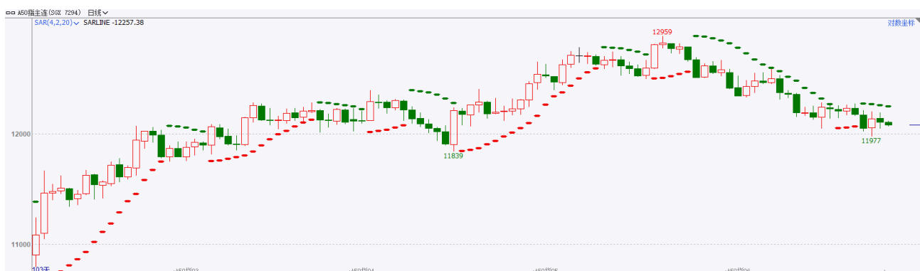
图4：富时中国A50走势图

截至6月25日，富时中国A50指数收跌0.15%至12122.58点；新交所富时A50期指主力合约收跌0.24%至12083点。此前发布的5月份国内经济数据整体呈弱稳态势，通胀依旧低位运行，加上政策端目前处于真空期，市场风险偏好整体承压。后续在稳增长政策不断加码和三中全会临近的情况下，市场情绪将逐步得到修复，但短期仍有调整的可能。策略上，建议短线逢高沽空。