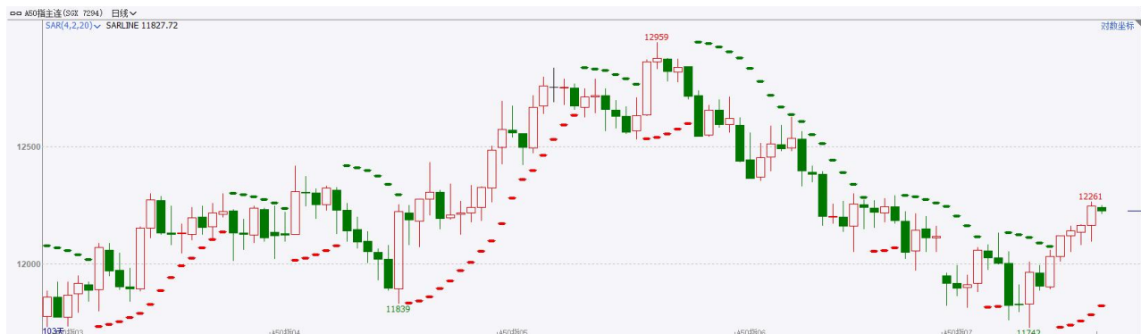
图4：富时中国A50走势图

截至7月17日，富时中国A50指数上涨0.46%至12267.18点；新交所富时A50期指主力合约上涨0.67%至12244点。6月份及上半年经济数据显示，GDP、工业增加值、消费、投资同比增速均较前值有所回落，房地产市场仍处于探底阶段，通胀低位运行，仅进出口数据表现较好，整体经济数据仍然偏弱。目前，市场交投谨慎，等待三中全会政策指引，若政策刺激的预期落空则有回调的可能。策略上，建议暂时观望。