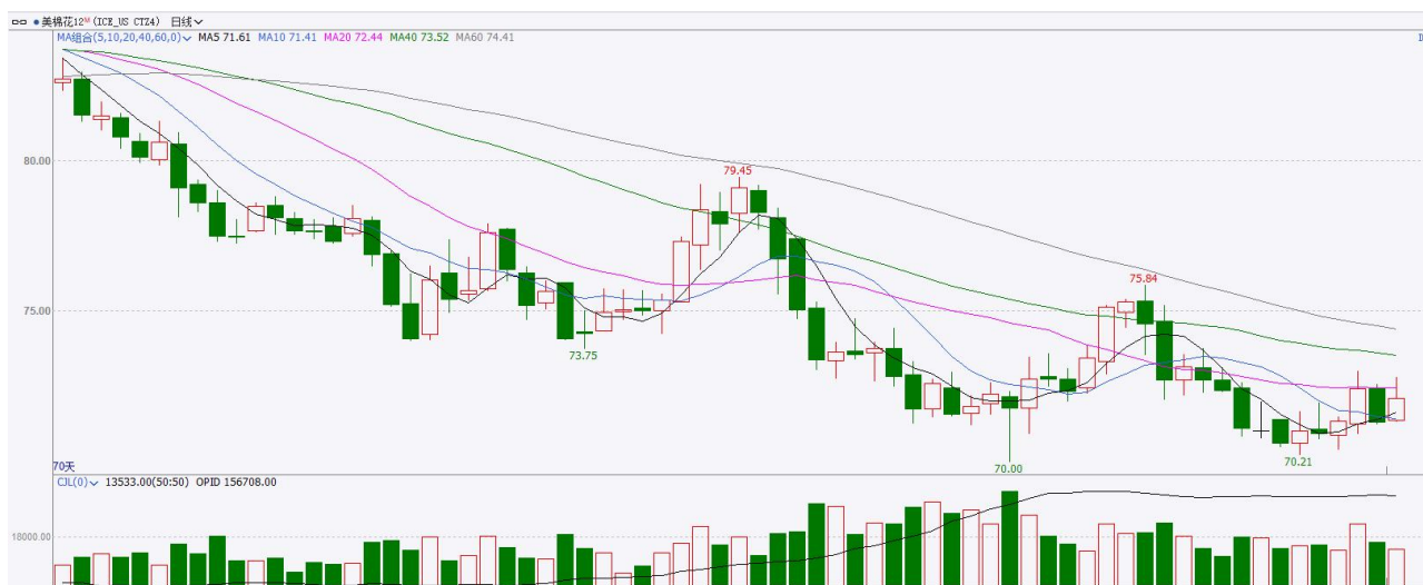
图8：ICE棉花期货主力合约日走势图

美棉主力价格关注上方压力78.0美分/磅，下方支撑65.0美分/磅。建议12月 ICE 期棉短期观望。