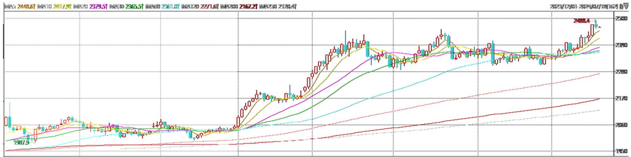
图6：COMEX黄金日线走势图

。往后看，短期内在市场对美联储降息及美国宽财政预期增加的影响下美元指数及美债收益率或相对承压，贵金属价格或多得到一定支撑。操作上建议，日内逢低做多，请投资者注意风险控制。