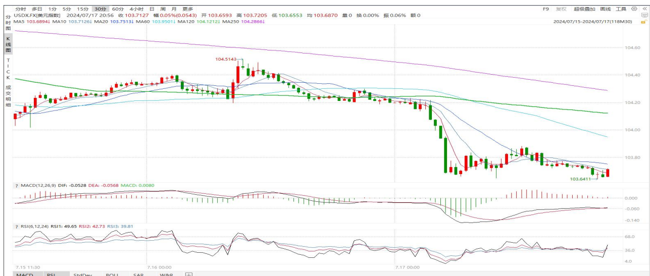
图表2：美元指数走势图

往后看，美联储官员的言论巩固了市场对9月份美国降息的押注，尽管周二的美国零售销售数据显示出消费者的韧性，并提振了全球最大经济体第二季度的增长前景，但这未能显著改变市场对美联储9月降息的预期。短期看美元偏低位震荡。