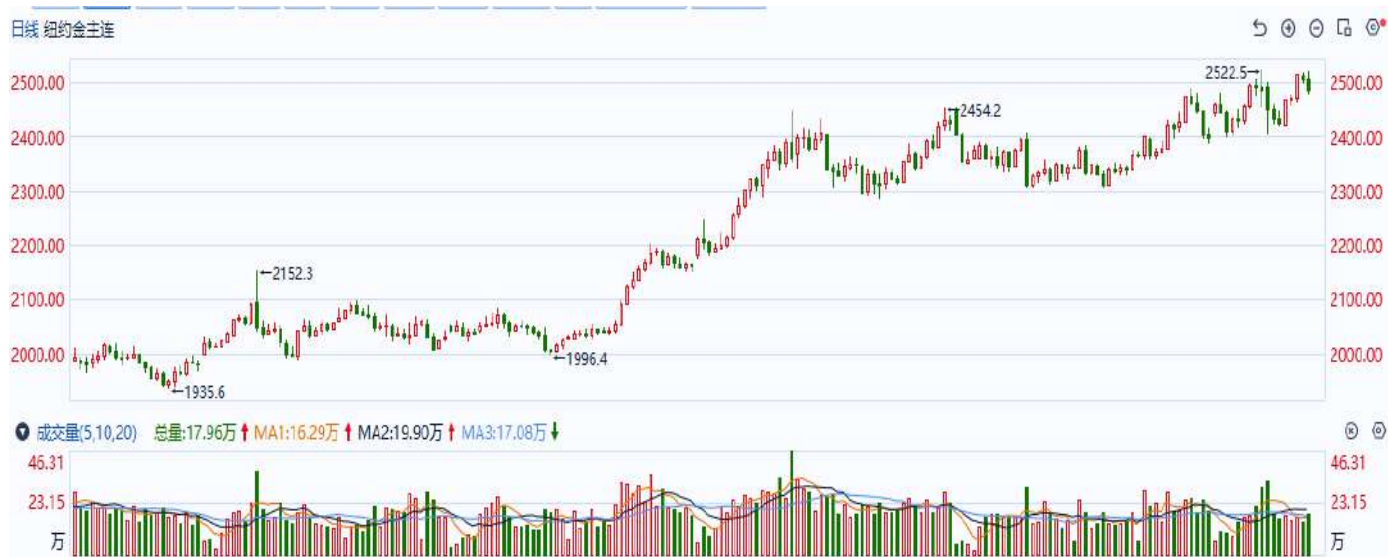
图表6：COMEX黄金日线走势图

巴局势暂时未见显著进展，尽管达成协议的预期存在，但短期内对贵金属避险需求的支撑有限，市场对此反应平淡。最新美国经济数据呈现分化：12月芝加哥PMI录得持续走低，反映制造业活动进一步放缓，强化经济增长趋缓的预期；而12月达拉斯联储商业活动指数及11月成屋签约销售指数环比大幅增长，显示部分经济领域仍具韧性，这对美元指数构成一定支撑，进而压制贵金属价格表现。短期内美债收益率的上行和美股的调整对市场风险偏好形成抑制，这或许为黄金价格提供一定的支撑。展望未来，市场焦点正逐步转向1月特朗普正式上任的政策动态，以及美联储FOMC会议对货币政策路径的进一步指引。短期内市场可能继续消化美国经济的上调预期，叠加美联储官员陆续释放的鹰派信号，利率预期回升或继续支撑美元指数，贵金属价格预计将面临一定压力。操作上建议，日内轻仓逢高试空，请投资者注意风险控制。