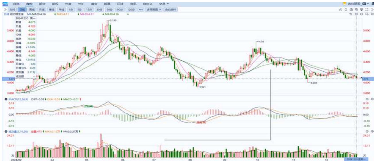
图表5：铜日线走势图

隔夜COMEX铜震荡偏弱走势，报收4.090美元/磅，涨跌幅-0.78%。国际方面，市场预期特朗普上台后将放宽监管、减税、提高关税和收紧移民政策。国内方面，财政部进一步明确新能源汽车政府采购比例要求，在年度公务用车采购总量中，新能源汽车占比原则上不低于30%。其中，对于路线相对固定、使用场景单一、主要在城区行驶的机要通信等公务用车，原则上100%采购新能源汽车。库存方面，截至12月30日，LME铜库存为271400吨，环比-1325吨；COMEX铜库存95170短吨，环比-420短吨；SHFE每日仓单17184吨，环比+4173吨。美元美债方面，美元指数继续徘徊在两年高位，最终收涨0.05%，报108.06。基准的10年期美债收益率收报4.5430%；对货币政策更敏感的两年期美债收益率收报4.2600%。操作建议，纽铜主力合约轻仓震荡偏弱交易，仅供参考。