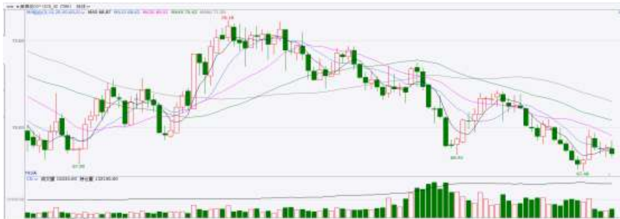
图表9：ICE棉花期货主力合约日走势图

洲际交易所(ICE)棉花期货周一在清淡的假日交易中回落，受强势美元的拖累。交投最活跃的ICE 3月期棉收跌0.41美分或0.60%，结算价报68.48美分/磅。巴西棉播种进度较去年同期稍慢。据巴西农业部下属的国家商品供应公司CONAB，截至12月22日，巴西棉花播种率为19.92%，上周为12.2%，去年同期为21.8%。