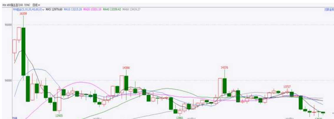
图表4：富时中国A50走势图

截至1月8日，富时中国A50指数上涨0.17%至12991.31点；新交所富时A50期指主力合约上涨0.03%至12984点。国内方面，经济基本面，12月官方、非官方制造业PMI均较上月有所下滑，但仍保持在扩张区间，国内制造业生产经营活动保持活跃。政策面，昨日国务院新闻办公室举行国务院政策例行吹风会，多部门负责人针对“两新”政策实施做了介绍，“两新”政策加大力度实施对增加经济有效需求起到推动。海外方面，特朗普将于1月下旬正式就职，需观察其上台后对华政策。整体来看，受到春节前部分投资者获利了结，离场观望影响，使得岁末市场交易整体较为清淡。此外，预计春节前将有部分政策率先落地，以此对冲海外扰动带来的影响，春节后市场流动性有望得到进一步提升，在此情形下业绩较为稳定的大盘股预计占优。策略上，在政策落地前建议暂时观望。