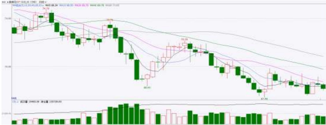
图表9：ICE棉花期货主力合约日走势图

，较前周增加9%，较前4周平均水平增加2%。当周美国棉花出口签约量增加，出口销售有所改善。美棉主力价格关注上方压力72美分/磅，下方支撑65.0美分/磅。建议3月 ICE 期棉短期观望。