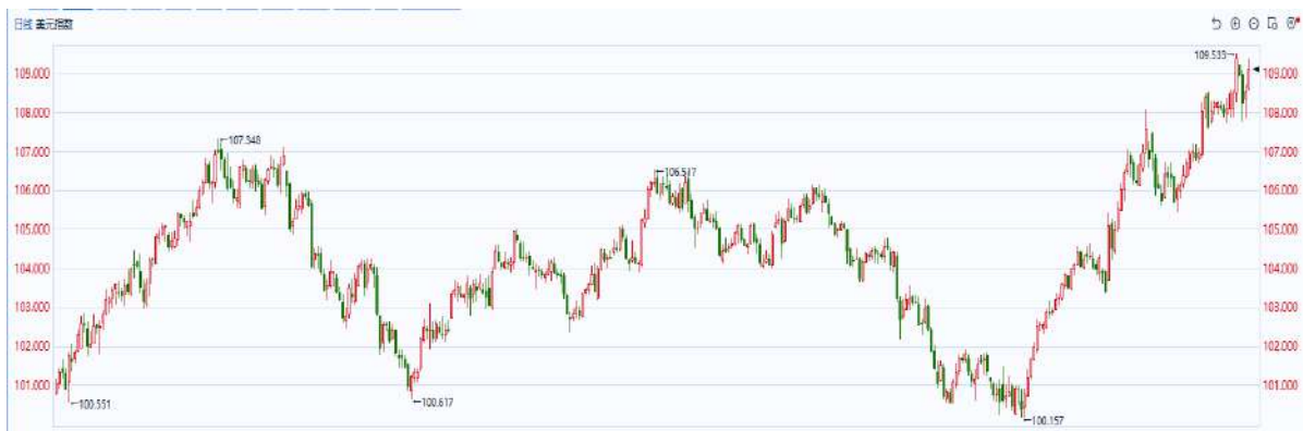
图表2：美元指数走势图

往后看，随着特朗普即将正式入主白宫，市场交易方向上的分歧可能加剧，消息面扰动可能进一步放大盘面波动。预计美元将延续震荡偏强的走势。重点关注本周五美国非农就业数据。