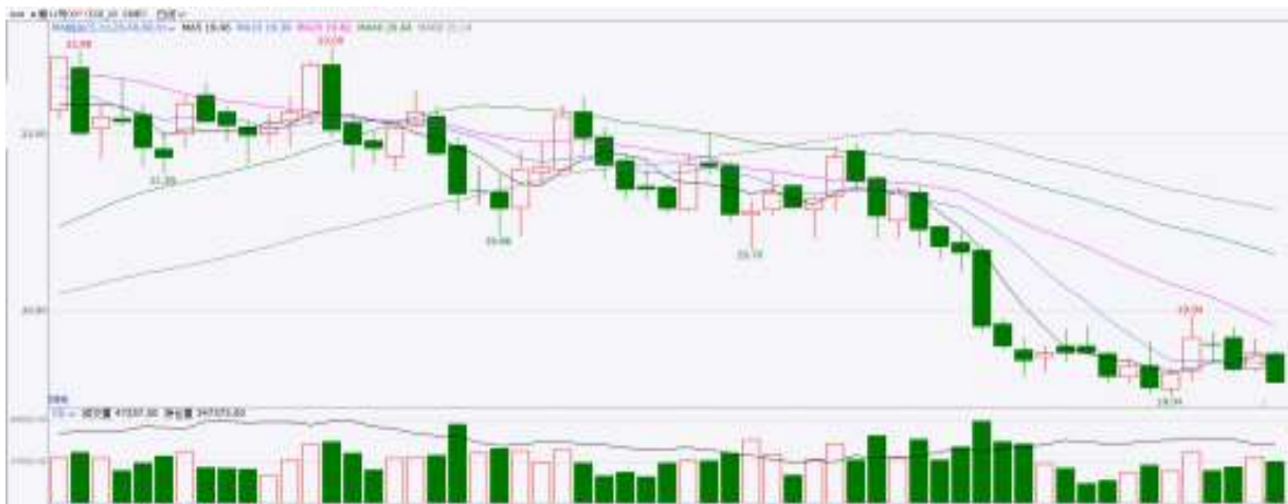
图表8：ICE原糖期货主力合约日走势图

洲际期货交易所（ICE）原糖期货周三收低，美元走强带来压力。交投最活跃的ICE 3月原糖期货合约收盘跌0.21美分或1.10%，结算价每磅19.24美分。巴西12月上半月压榨数据低于预期，累计产量不足4000万吨，巴西榨季进入尾声，市场关注点转至北半球。据印度全国糖业联合会(NFCSF)消息，24/25榨季截至2024年12月31日印度累计压榨甘蔗1.09565亿吨，产糖951万吨，上年度同期为1128万吨，同比下降15.7%。当前共有493家糖厂开榨，当前甘蔗压榨量和产量均低于上一年度同期水平。美糖主力价格关注上方压力21.0美分/磅，下方支撑18.0美分/磅。建议3月 ICE 期糖短期观望。