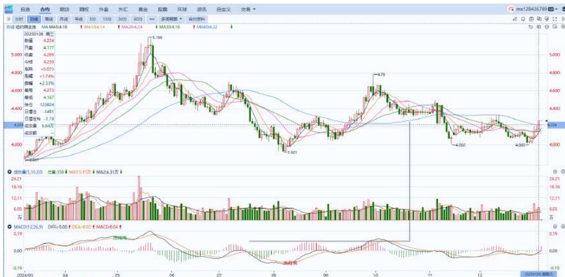
图表5：铜日线走势图

，环比-801吨。美元美债方面，特朗普正考虑宣布全国经济紧急状态，以便征收大量普遍关税，全球债券继续被抛售，美元指数得到提振，最终收涨0.29%，报108.99。基准的10年期美债收益率收报4.7060%；对货币政策更敏感的两年期美债收益率收报4.2970%。操作建议，纽铜主力合约轻仓逢低短多交易，仅供参考。