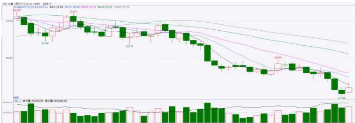
图表6：ICE原糖期货主力合约日走势图