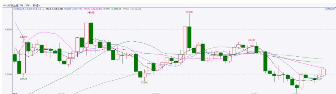
图表3：富时中国A50走势图

截至1月20日，富时中国A50指数上涨0.69%至13020.53点；新交所富时A50期指主力合约上涨0.78%至12981点。海外方面，特朗普将于昨日晚间正式就职，需警惕其对华政策带来的冲击。国内方面，经济基本面，2024年全年经济增长目标顺利完成，工业生产对经济起到重要支撑。同时，全年进出口贸易表现亮眼，出口规模创新高。固定资产投资整体偏弱，呈逐步走弱态势。居民消费在以旧换新政策的支持下，预计成为新的经济增长点。货币政策方面，昨日公布的1月份LPR维持不变，央行或在等待特朗普上台后再行决策，关注年前降准可能。整体来看，本周市场进入宏观数据真空期，此前已落地部分政策预计持续发挥效果，后续市场博弈海外政策冲击与国内政策加码对冲力度，年后或开启对两会政策预期的交易，届时市场流动性有望得到进一步提升，春季行情或在酝酿当中。策略上，建议回调逢低布局。