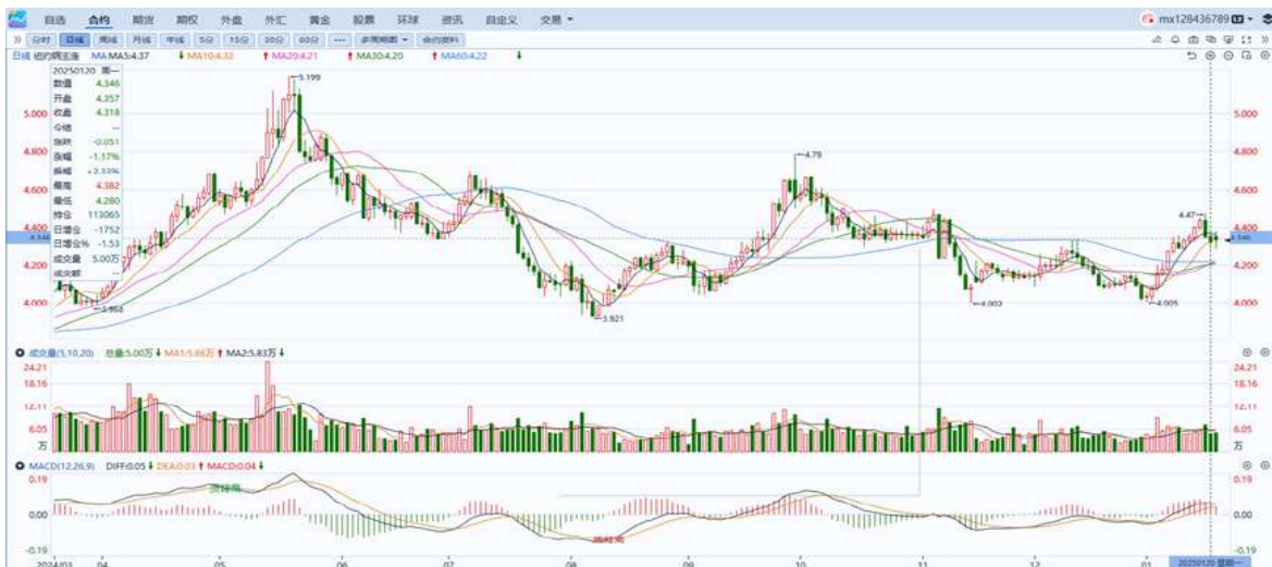
图表4：铜日线走势图

隔夜COMEX铜震荡偏弱，报收4.318美元/磅，涨跌幅-1.17%。国际方面，特朗普正式宣誓就职美国总统，宣布国家能源紧急状态，加大传统能源开采，结束拜登政府“绿色新政”，撤销电动车优惠政策以拯救美国传统汽车工业；建立对外税务局，对外国进口产品加征关税等。国内方面，国家主席习近平：2025年要实施更加积极有为的宏观政策，推动高水平科技自立自强。库存方面，截至1月20日，COMEX铜库存为95499短吨，环比+263短吨（马丁路德金日暂停交易）；LME铜库存260150吨，环比+75吨；SHFE每日仓单15449吨，环比+258。美元美债方面，美元指数日内大跌超1%，失守109关口并跌至108关口附近，最终收跌1.22%，报108.08。美债市场因马丁路德金纪念日休市一日。操作建议，纽铜主力合约轻仓震荡交易，仅供参考。