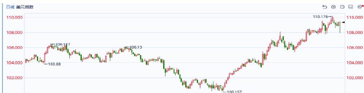
图表1：美元指数走势图

往后看，市场短期内可能继续消化特朗普关税政策延期带来的通胀预期回落影响，近期特朗普相关的消息面扰动可能进一步放大盘面波动，预计美元将延续震荡的走势。