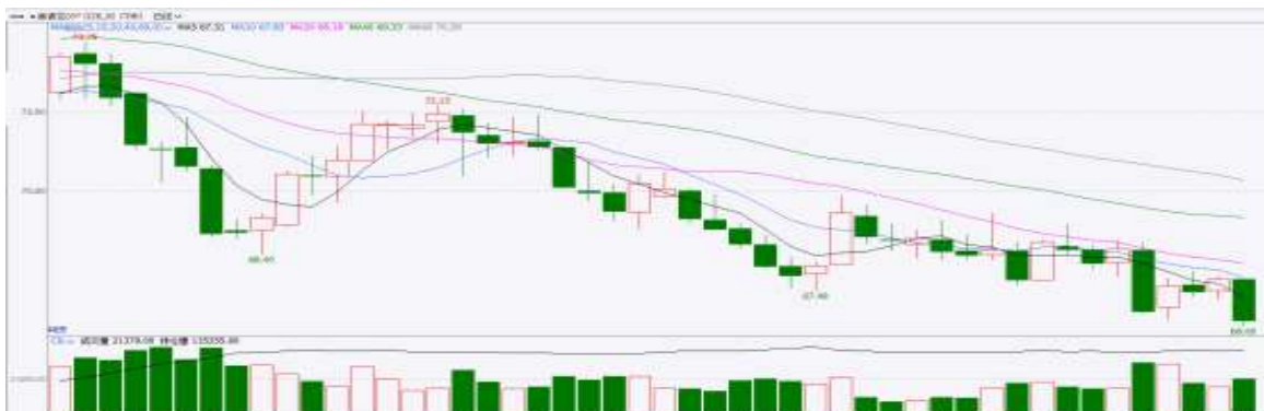
图表7：ICE棉花期货主力合约日走势图