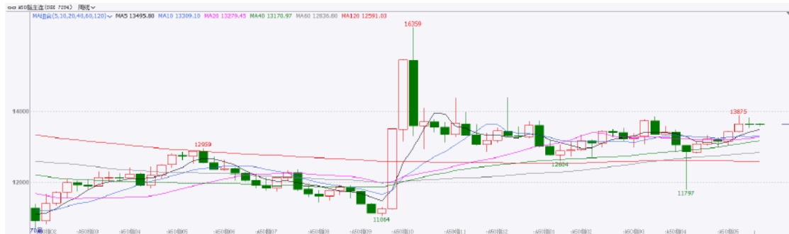
图表3：富时中国A50走势图

成为社融增量主要支撑，同时，在货币、财政政策共同发力下，4月份社融存量、M2增速均超预期。此外，5月LPR下调进一步强化货币政策宽松导向，旨在降低实体经济融资成本，刺激有效信贷需求。整体来看，目前国内经济基本面小幅走弱，对市场情绪产生一定负面影响，加上市场在关税战缓和后持续修复，目前指数在触及四月初的水平后，上方面临较大压力，虽然国内宏观支持政策已相继出台，但仍需等待政策效应的发挥，短期预计维持震荡。策略上建议暂时观望。