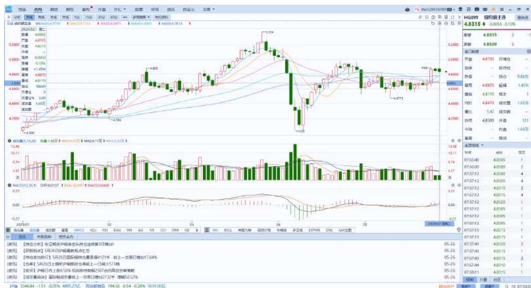
图表4：铜日线走势图

隔夜COMEX铜震荡走势，报收4.8315美元/磅，涨跌幅-0.1%。国际方面，明尼阿波利斯联储主席卡什卡利表示，由于贸易政策、移民政策及财政政策等多方面的不确定性，宽松政策暂停期可能更长，美联储需等待形势更明朗后才能做出决策。国内方面，国财政部：去年四季度以来，中国政府实施一揽子宏观经济调控政策，经济指标回升向好，市场预期和信心稳定，债务中长期可持续性增强。库存方面，截至5月26日，COMEX铜库存为175631短吨，环比+1024短吨；LME铜库存为164725吨，环比-1800吨；SHFE每日仓单32833吨，环比-573吨。美元美债方面，因特朗普政策大转弯，以及他目前正在推动的全面支出和减税议案令投资者对美国资产望而却步，美元指数持续下行，跌破99关口，最终收跌0.15%，报98.95。操作建议，纽铜主力合约轻仓逢低短多交易，仅供参考。