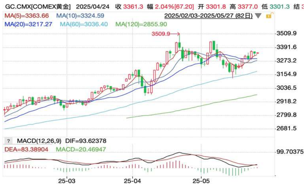
图表5：COMEX黄金日线走势图

隔夜，国际贵金属期货收盘涨跌不一，COMEX黄金期货跌0.7%报3342.2美元/盎司，COMEX白银期货涨0.11%报33.645美元/盎司。因美国对欧洲的关税获得暂缓期，市场避险情绪略有降温，金价小幅回调。俄罗斯周日对乌克兰发动战争以来最大规模空袭，地缘局势持续紧张提振黄金避险属性。特朗普上周五再次提出对欧盟商品征收关税，但随后表示同意延期，再度凸显特朗普政策的摇摆不定，关税预期的反复推动避险资金流入黄金。美元信用评级下调反映债务风险加剧，特朗普减税法案加剧市场对于美债供应的担忧，美债收益率大幅上行，美元信用风险抬升中长期为金价提供结构性支撑。隔夜暂无重要经济数据发布，此前公布的美国5月标普全球综合PMI略有回升，企业活动边际改善，劳动力市场韧性有所分化，初请失业金人数持续下行，而持续申领人数呈上升趋势，表明企业招聘意愿因关税不确定性受抑。中长期而言，此前公布的CPI及PPI数据释放降温信号，一定程度上为年内美联储降息做好铺垫，但考虑到未来关税政策变数犹存，不确定性或继续放大，美国债务问题持续或使全球去美元趋势持久化，中长期金价仍受到避险需求和美元走软提振。新兴国家央行的购金需求以及黄金ETF的持续净流入表明黄金投资需求稳固。操作上建议，维持中长期逢低布局思路，短期内注意回调压力。COMEX黄金期货关注区间：3257-3397美元/盎司，COMEX白银期货关注区间：33.0-34.2美元/盎司。