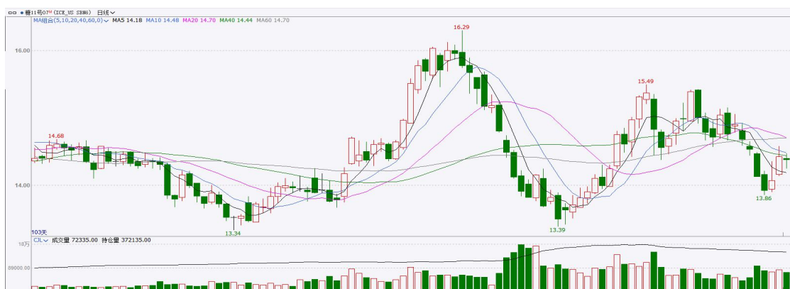
图表6：ICE原糖主力合约价格走势

美糖主力价格关注上方压力15.0美分/磅，下方支撑13.50美分/磅。建议7月 ICE 期糖短期观望。