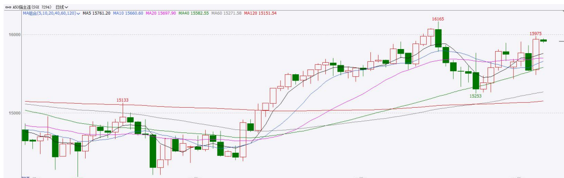
图表3：富时中国A50走势图

截至6月2日，富时中国A50指数上涨2.09%至16029.85；新交所富时A50期指主力合约上涨2.53%至15936。海外方面，英伟达首席执行官黄仁勋表示，英伟达将扩大其面向PC产品线的AI芯片产品线。他还指出，智能体AI将开启未来十年算力革命。此外，AI巨头Anthropic日前宣布，已秘密向美国证券交易委员会提交了IPO申请。海外人工智能浪潮仍在不断推进。国内方面，经济基本面，5月我国三大官方PMI指数均维持在荣枯线上方，其中，制造业PMI较上月下滑，非制造业及综合PMI则出现上升。然而，高技术制造业与装备制造业PMI仍在进一步走高。消息面，存储芯片巨头长鑫科技科创板IPO过会后，重量级IPO使得市场对板块流动性被稀释抱有担忧。芯片板块震荡走弱。整体来看，新质生产力对经济的支撑利好相关行业股价，同时，海外人工智能行情仍未结束，但国产芯片巨头上市对流动性的稀释效果或使得相关板块承压，令A股与海外股市出现背离，市场整体短期或步入震荡态势。