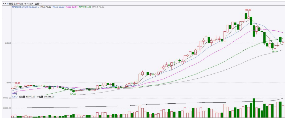
图表7：ICE美棉主力合约价格走势图

国际方面，巴西棉花种植者协会（Abrapa）发布月度报告显示，巴西4月棉花出口了37.04万吨，同比大增54.9%，环比增加6.5%，创下月度记录新高。2025/26年度（2025年8月-2026年4月）累计棉花出口达271.1万吨，同比增加了13.7%，其中4月，中国、巴基斯坦和孟加拉国进口了18.93万吨棉花，占比51%。