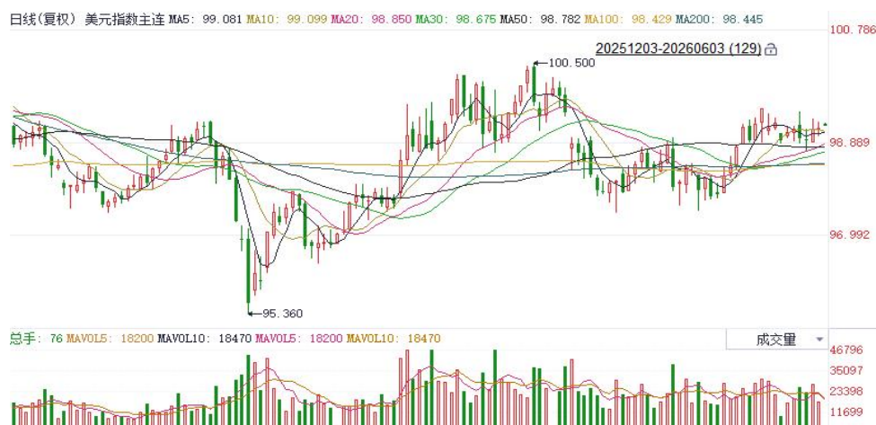
图表1：美元指数走势图

欧洲央行4月会议纪要显示，部分官员实际上已倾向于支持加息。能源供给冲击持续拖累欧元区增长前景，在增长乏力与高通胀并存的困境下，市场继续维持欧央行年内三次加息预期。日本央行行长表示由油价驱动的通胀风险趋于上行，但并未明确给出加息信号，亦有官员重申加息承诺，同时指出加息时点与节奏将取决于中东冲突如何影响日本经济及通胀前景。往前看，伴随停火预期逐步兑现，美国与非美关键利差预期有望收敛，后续或对欧元及日元表现形成边际提振。