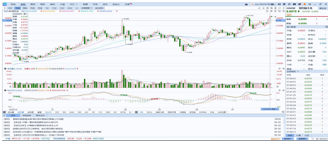
图表4：铜日线走势图

持续居高不下，政策层面可能很快需要采取行动——包括考虑进一步加息，以应对通胀持续高企的风险。国内方面，国家发改委主任郑栅洁主持召开国有企业座谈会，围绕深化国资国企改革、纵深推进全国统一大市场建设、促进绿色低碳发展、保障能源安全等国家重大战略，听取企业情况介绍和意见建议。郑栅洁表示，要提升国有企业科技创新、产业控制、安全支撑功能。库存方面，截至2026年6月2日，COMEX铜库存为642045短吨，环比-53短吨；LME铜库存为384250吨，环比-1800吨；SHFE每日仓单98629吨，环比-914吨。美元美债方面，尽管市场传出众多关于美伊谈判的消息，但投资者对有关结束美以对伊战争的进展消息持谨慎态度。美元指数先跌后涨，但依旧稳站在99关口上方，最终收涨0.01%，报99.20；基准的10年期美债收益率收报4.446%，对美联储政策利率敏感的2年期美债收益率则收报4.051%。操作建议，纽铜主力合约轻仓逢低短多交易，仅供参考。