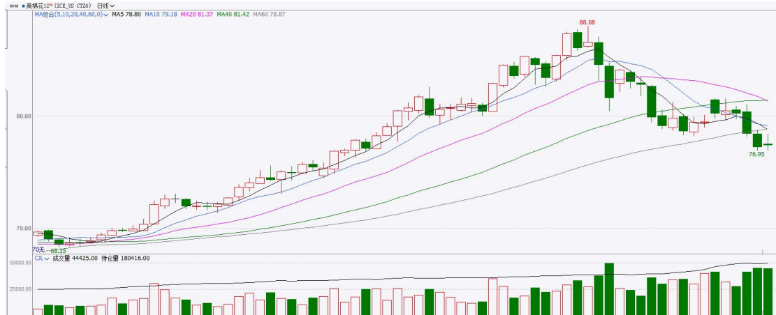
图表7：ICE美棉主力合约价格走势

国际方面，巴据美国农业部(USDA)报告显示，5月28日止当周，美国当前年度陆地棉出口销售净增18.52万包，较前周增加21%，较前四周均值增加62%。当周美国陆地棉出口装运量26.88万包，较前周减少15%，较前四周平均水平减少12%。当周美国棉花出口签约量增加、装船量环比下降。