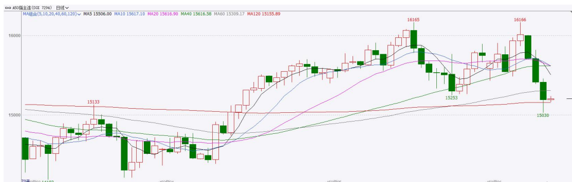
图表3：富时中国A50走势图

截至6月8日，富时中国A50指数下跌1.59%至15373.72；新交所富时A50期指主力合约下跌1.44%至15191。海外方面，包括谷歌、英伟达、SK海力士在内的多家AI芯片设计企业已开始将英特尔纳入备选代工商，其中谷歌已正式向英特尔下单超300万枚TPU。消息带动AI交易重燃，但苹果不及预期的全球开发者大会限制了美股整体反弹力度。同时，美国5月非农就业人数超预期上行，结合此前公布的职位空缺数和ADP就业报告，可以看出劳动市场仍具备一定韧性，令美联储加息预期进一步上升。国内方面，经济基本面，5月我国三大官方PMI指数均维持在荣枯线上方，其中，制造业PMI较上月下滑，非制造业及综合PMI则呈现上升。然而，高技术制造业与装备制造业PMI仍在进一步走高。消息面，存储芯片巨头长鑫科技科创板IPO过会后，重量级IPO使得市场对板块流动性被稀释抱有担忧。芯片板块震荡走弱，拖累期指下跌。整体来看，新质生产力对经济的支撑利好相关行业股价，然而，美联储加息预期的升温带来的流动性趋紧预期，对海外人工智能浪潮有负面影响，同时海外人工智能巨头上市带来的虹吸效果以及此前国内长鑫科技上会均对A股科技板块产生流动性稀释，使得相关板块承压，市场整体短期或步入震荡态势。