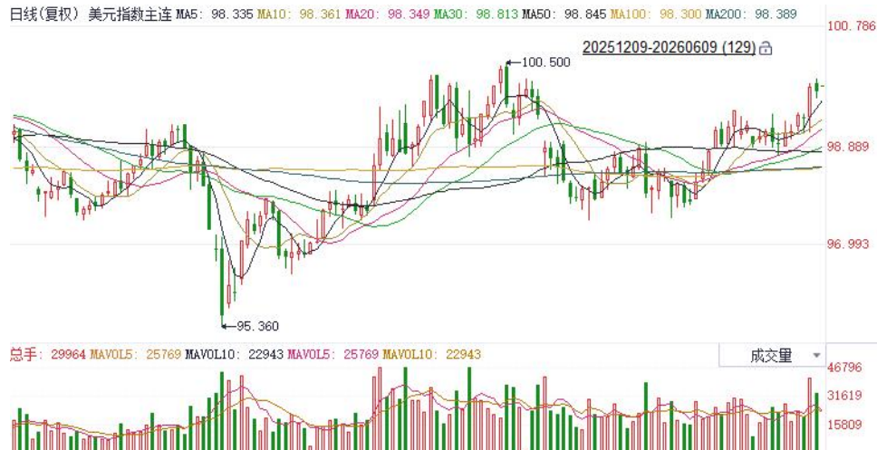
图表1：美元指数走势图

从能源领域向更广泛的经济部门扩散。日本4月实际工资实现连续四个月增长，创2021年底以来最长连涨纪录，为6月央行加息提供有力支撑，但受中东局势拖累，家庭实际消费支出同比维持收缩态势。往前看，伴随停火预期逐步兑现，美国与非美关键利差预期有望收敛，后续或对欧元及日元表现形成边际提振。