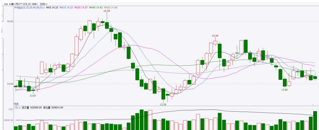
图表6：ICE原糖主力合约价格走势图

美糖主力价格关注上方压力15.0美分/磅，下方支撑13.50美分/磅。建议7月 ICE 期糖短期观望。