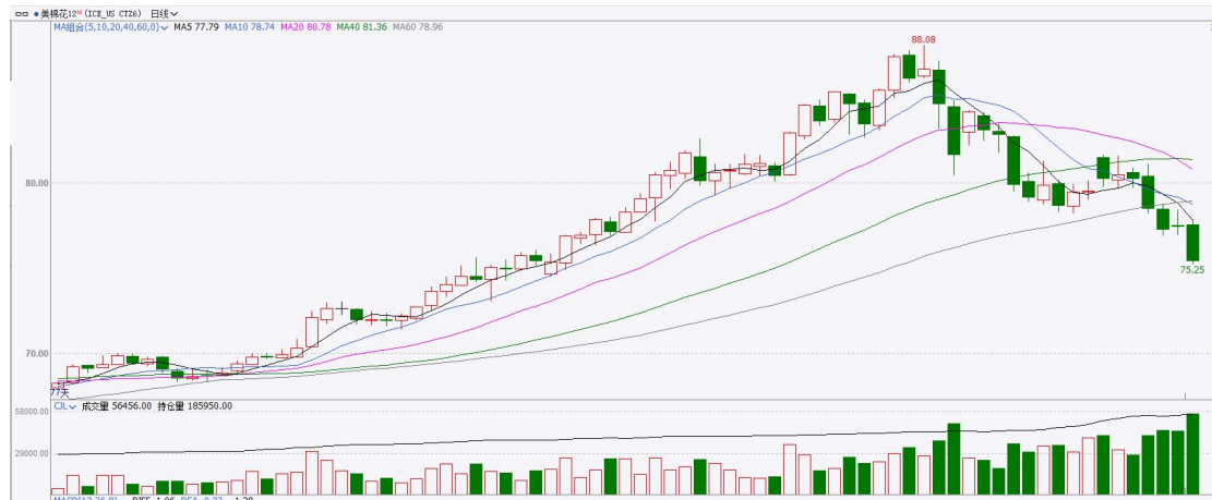
图表7：ICE美棉主力合约价格走势

国际方面，巴据美国农业部(USDA)报告显示，5月28日止当周，美国当前年度陆地棉出口销售净增18.52万包，较前周增加21%，较前四周均值增加62%。当周美国陆地棉出口装运量26.88万包，较前周减少15%，较前四周平均水平减少12%。当周美国棉花出口签约量增加、装船量环比下降。