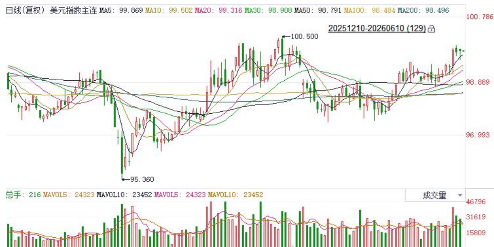
图表1：美元指数走势图

非美方面，利率期货显示欧央行将于本月展开25基点加息，后续或仍有2-3次加息空间，当前鹰派定价主要受最新通胀数据驱动，欧元区5月通胀增速创逾两年半新高，核心通胀同步加速，显示价格压力正从能源领域向更广泛的经济部门扩散。日本4月实际工资实现连续四个月增长，创2021年底以来最长连涨纪录，为6月央行加息提供有力支撑，但受中东局势拖累，家庭实际消费支出同比维持收缩态势。往前看，当前非美主要货币走势仍受到强美元压制，但中长期而言，伴随美伊局势逐步趋缓，美国与非美关键利差预期有望收敛，后续或对欧元及日元表现形成边际提振。