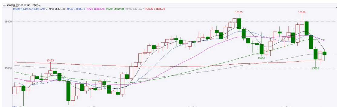
图表3：富时中国A50走势图

截至6月9日，富时中国A50指数上涨1.22%至15561.99；新交所富时A50期指主力合约上涨1.07%至15353。海外方面，包括谷歌、英伟达、SK海力士在内的多家AI芯片设计企业已开始将英特尔纳入备选代工商，其中谷歌已正式向英特尔下单超300万枚TPU。消息带动AI交易重燃。此外，美国5月非农就业人数超预期上行，结合此前公布的职位空缺数和ADP就业报告，可以看出劳动市场仍具备一定韧性，令美联储加息预期进一步上升。国内方面，经济基本面，5月我国进出口延续高增长态势，出口边际增速高于进口，带动贸易顺差上行。同时，高新技术产品出口增速大幅领先整体水平。消息面，燧原科技与粤芯半导体申请IPO，而此前长鑫科技、宇树科技已相继过会，具有硬实力的科技企业陆续申请IPO，反映出当前市场对AI主题的热情依旧存在，但头部科技企业集中上市后也将对行业流动性产生稀释。整体来看，新质生产力对经济的支撑利好相关行业股价，然而，市场对于AI行情的情绪已十分谨慎，不及预期的数据或消息均会加剧市场波动，加上美联储加息预期的升温带来的流动性趋紧预期，对海外人工智能浪潮有负面影响，最后海内外科技巨头相继递交IPO申请后带来的流动性稀释效果，使得相关板块承压，市场整体短期或步入震荡态势。