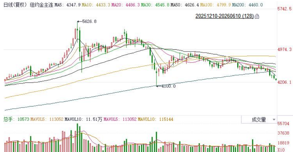
图表5：COMEX黄金日线走势图