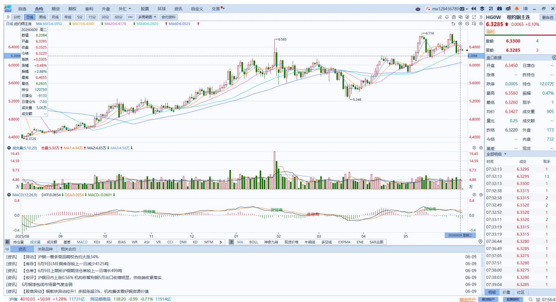
图表4：铜日线走势图

面，国家信息中心先行指标显示，随着宏观政策协同发力，5月我国经济稳中向好，投资向新向优步伐加快。5月份，人工智能、人形机器人等前沿领域投资额同比增长约五倍；算力、数据、网络等领域的基础设施项目中标金额同比增长约一倍。库存方面，截至2026年6月9日，COMEX铜库存为647761短吨，环比+1494短吨；LME铜库存为372650吨，环比-4125吨；SHFE每日仓单95543吨，环比+499吨。美元美债方面，由于中东停火局势脆弱，美元指数先跌后涨，日内几乎呈现“V型走势”，最终收跌0.04%，报99.95；基准的10年期美债收益率收报4.522%，对美联储政策利率敏感的2年期美债收益率则收报4.135%。操作建议，纽铜主力合约轻仓逢低短多交易，仅供参考。