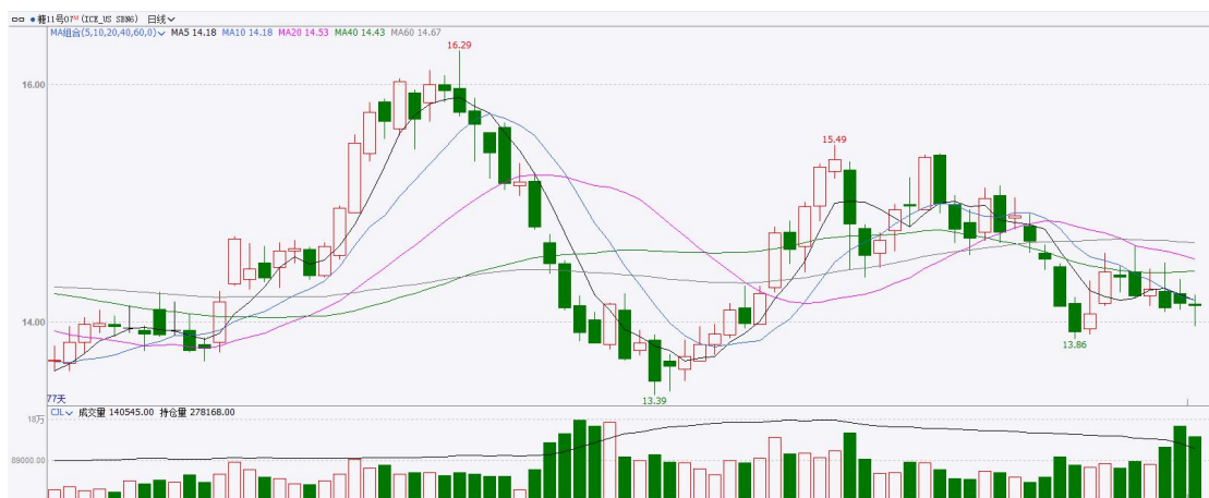
图表6：ICE原糖主力合约价格走势图

美糖主力价格关注上方压力15.0美分/磅，下方支撑13.50美分/磅。建议7月 ICE 期糖短期观望。